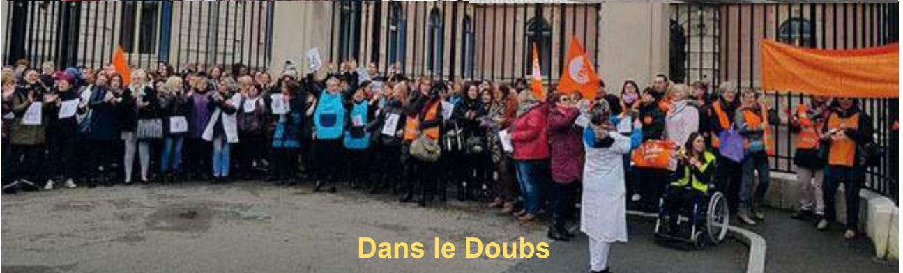
Dans le Doubs