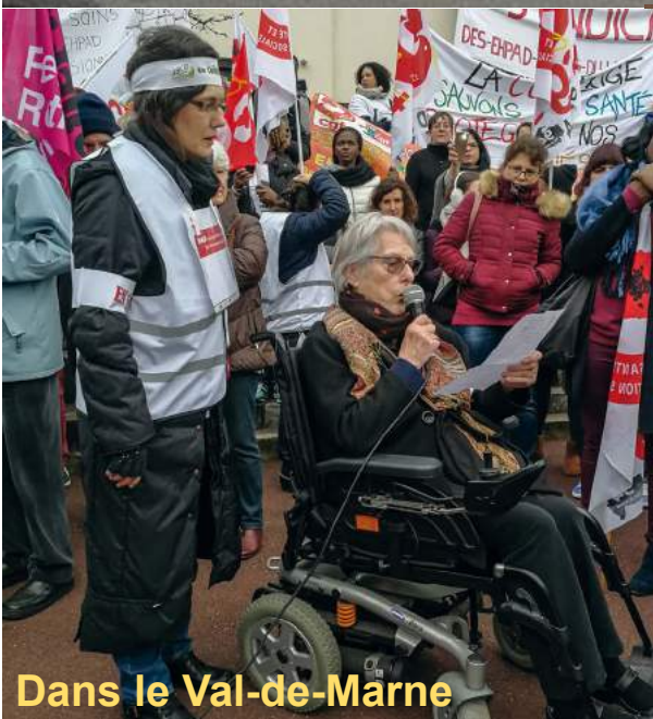
Dans le Val-de-Marne