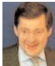
REPONSE DE P. BAS JO 05/12/2006

La FNAPAEF et l'ADEHPA souhaitent que soient créés en nombre suffisant des postes de personnels infirmiers, d'aides-soignants, de kinésithérapeutes, d'ergothérapeutes, d'agents de service et d'accompagnement afin de prévenir la diminution de l'autonomie et les risques liés au vieillissement tant à domicile qu'en établissement (...).